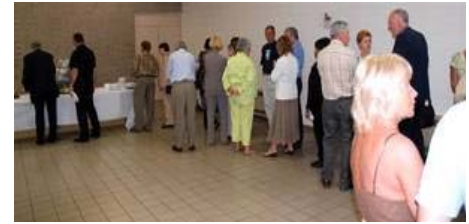
Photo prise sur le site de l'AGPQ : Un groupe de grands-mères et de grands-pères brunchant ensemble lors d'une activité de l'AGPQ.

(3) développer une expertise de terrain, en coordination avec les acteurs existants à Beauport (organismes, institutions, etc.) Les situations d'abus sont généralement niées, et cachées dans 80% des cas. L'Association des Grands-Parents du Québec (AGPQ) http://www.grands-parents.qc.ca L'AGPQ écoute, informe, accompagne et soutient les grands-parents et les aînés vivant des difficultés dans un contexte familial. ☺ D.R